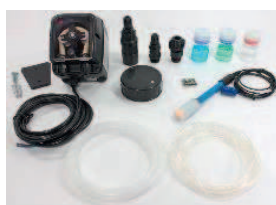
pH kit including dosing pump